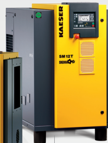
SM 0,30 – 1,50 m 3 /min 8 – 11 – 15 bar