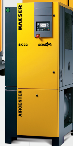
SK 1,30 – 2,50 m 3 /min 8 – 11 – 15 bar