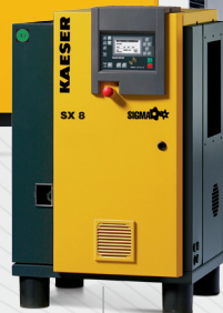
SX 0,26 – 0,80 m 3 /min 8 – 11 – 15 bar