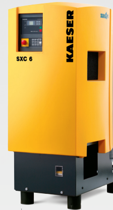
SXC 0,26 – 0,80 m 3 /min 7,5 – 10 – 13 bar