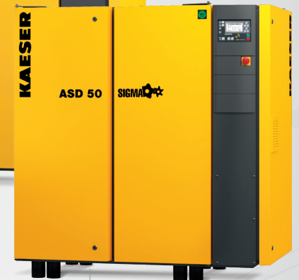
ASD 0,87 – 6,26 m 3 /min 5,5 – 15 bar

Vervang uw oude compressor door een moderne, meer efficiënte, energiezuinige generatie.