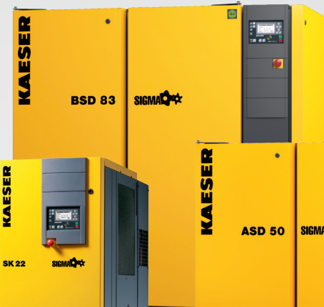
BSD 1,12 – 8,19 m 3 /min 5,5 – 15 bar