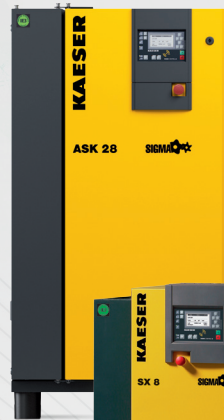
ASK 0,79 – 4,65 m 3 /min 5,5 – 15 bar